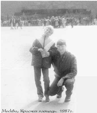
Москва, Красная площадь, 1987г.

гим, менее выгодным для меня образом. Дело в том, что удаления проводов я БОЯЛСЯ. Даже больше, чем пункции. Я ходил и выпрашивал у всех, кому провода уже вытаскивали обо всех подробностях этой процедуры. И с каждым рассказом боялся все сильнее. И вот настал тот день. Я взгромоздился на стол в процедурном кабинете. Было открыто окно. В кабинете было довольно свежо и меня сразу прохватила крупная дрожь. Дрожь усилывалась по мере того, как я углублялся в смысл и сущность этой процедуры. Подошла медсестра с бодрим видом. Сняла повязку с проводов. Я мысленно вскопил и убежал. Затем она начала шевелить провода, причиняя мне неприятные ощущения, о которых сказано выше. Я стал собирать остатки воли в кулак. Медсестра сказала: